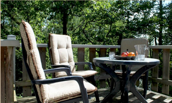
Eismeer 1 ca. 44 m² Wohnfläche zzgl. Terrassen ERDGESCHOSS